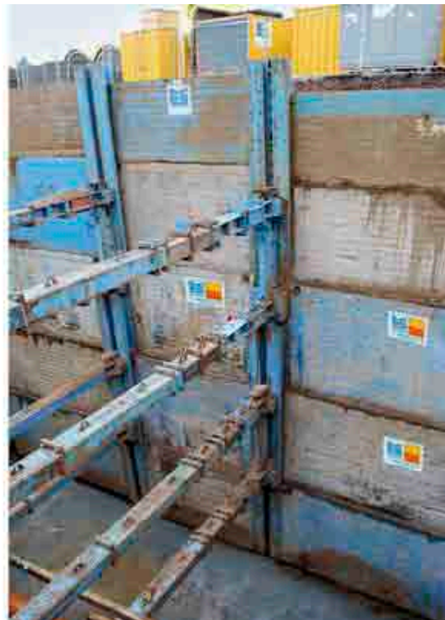
↑ Blindaggio lineare per grosse profondità